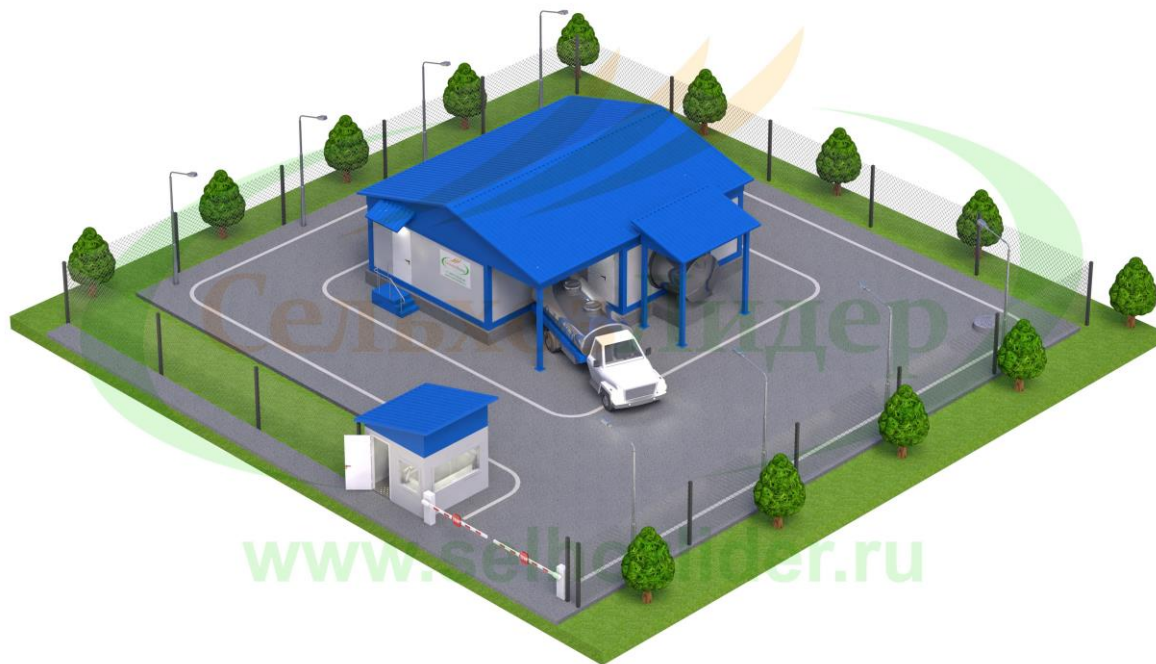
Схема размещения и состав оборудования мини-завода: